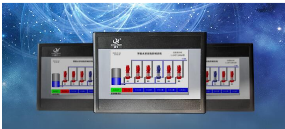
KZ 系列智能水泵巡检控制器